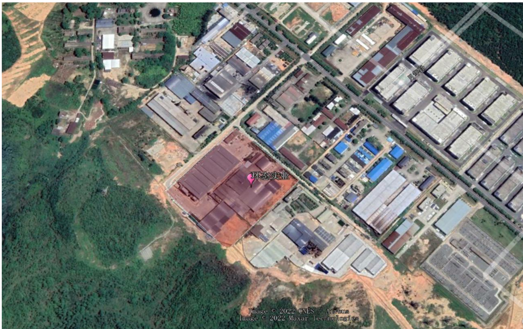
图 2.2-2 项目卫星位置图